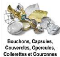
Bouchons, Capsules, Couvercles, Opercules, Collerettes et Couronnes