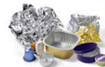
Capsules café, Bougies chauffe-plat, Barquettes, Boîtes et Feuilles