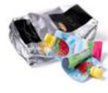
Sachets café Poches de compote